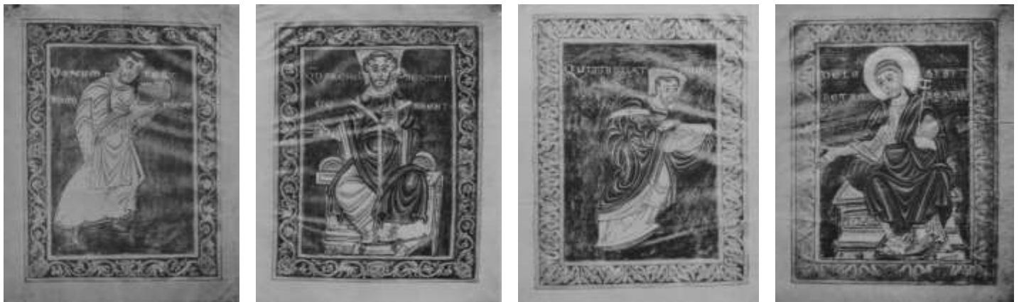
Илл.2. Посвятительные миниатюры Псалтыри Эгберта. Чивидале, Археологический музей, MS CXXXVI, лл.16v-18r. Воспроизводится по изданию: Sauerland H.V., Haseloff A. Der Psalter Erzbischof Egberts von Trier, Codex Gertrudianus, in Cividale.... Trier, 1901. Bd.2, Taf.1-4

Посвятительные миниатюры занимают по две целых страницы (разворот): слева изображения подносящего книгу, справа - принимающего. В первой сцене Эгберт показан в образе владыки, восседающего на престоле - как олицетворения высшей церковной власти. Трирский архиепископ представлен в литургическом облачении: на нем белая альба, золотистая далматика, пурпурная риза, стола и паллий. Правой рукой он благословляет, в левой держит педум. Эгберт изображен