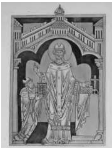
Илл.4 Посвятельная миниатюра: архиепископ Зальцбурга Эберхард перед св. Рупертом. Мюнхен, Баварская государственная библиотека, Clm15812б л.1r. Воспроизводится по изданию: Swarzenski, G. Die Salzburger Malerei von den ersten Anfängen bis zur Blütezeit des romanischen Stils.... Leipzig, 1908. Tafelband, Taf.115. Abb.396

Изображение целого ряда предшественников не единственный вариант продемонстрировать преемственность сана от святых предшественников – в художественном оформлении немецких рукописей XII в. существует и иной иконографический тип: посвятельные миниатюры, где епископ-заказчик представлен вместе со святым епископом, преемником которого он является. К этому типу относится миниатюра рукописи Clm15812 из собрания Баварской государственной библиотеки 16 , содержащая сочинение Аврелия Августина "De Genesi ad litteram" («О буквальном смысле Книги Бытия»). Книга была создана в скриптории при кафедральном соборе Зальцбурга по заказу архиепископа Эберхарда (1147-1167). Миниатюра находится на первом листе (1r) и представляет собой типичный для зальцбургской школы рисунок пером (красными и черными чернилами) с раскрашенным фоном (синий, зеленый). Эберхард преподносит кодекс святому покровителю Зальцбурга и патрону кафедрального собора – св. Руперту 17 , первому епископу Зальцбурга. Оба епископа представлены в архитектурном обрамлении, обозначающим пространство кафедрального собора, справа изображен алтарь, на который возложена книга (таким образом, книга показана два раза – подобный прием встречается и в других памятниках). Фигура святого значительно превышает по масштабу фигуру донатора, что характерно для подобных композиций. Оба церковных иерарха представлены в полном литургическом облачении (риза, далматика, альба, стола, митра) и с манипулами.