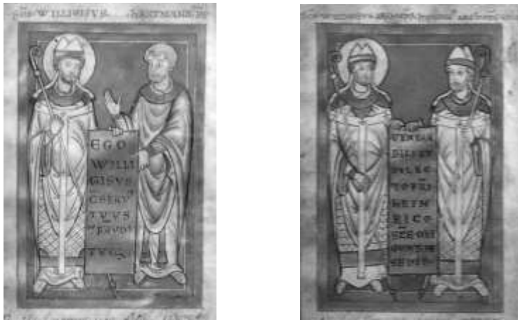
Илл.5. Посвятительные миниатюры «Службы св. Виллигизу с описанием его чудес». Российская государственная библиотека, Ф.183.1 №368, лл. 1v, 2v.

на миниатюре в качестве законного преемника (и тем самым равного по статусу) своего святого предшественника.