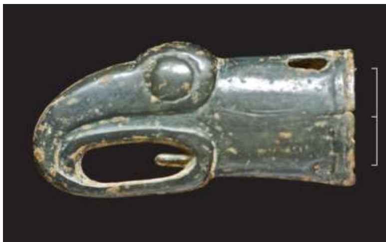
Рис. 7. Бутероль типа «Репяховатая Могила» с горного массива Агармыш

Из Крыма же происходят два уникальных изделия, являющиеся результатом композиционного эксперимента: свернувшийся хищник на малой бронзовой бляхе из кургана Кулаковского и двухфигурная композиция козы с козленком. И если первый образ не нашел дальнейшего развития, то второй, несомненно, связан с жаботинской иконографией лосихи с лосенком. Принимая во внимание более архаический для скифского искусства образ горного козла, можно предположить, что исходным пунктом этого влияния была крымская территория. Или же, учитывая, что изображение лосихи с лосенком выполнено не в саккызско-келермесской, а в жаботинско-константиновской манере, можно предположить, что обе двухфигурные композиции имели общий исток, остающийся пока не выявленным. В позднеархаическое время тенденция формирования стилистики общескифских образов на территории Крыма, скорее всего, усиливается, в связи с возрастающей ролью Боспора в производстве изделий скифского звериного стиля. Свидетельством этого являются образы кошачьего хищника из Золотого кургана и Пантикапея, а также головы грифона.