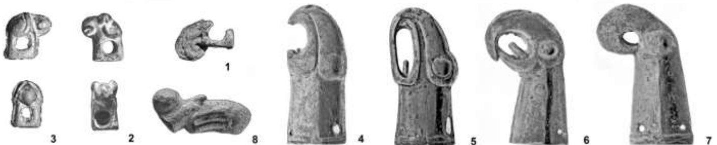
Рис. 2. Пряжки-распределители, бутероли и топорик. 1 – Межгорье; 2,5 – Агармыш; 3 – урочище «7-е поле» Красногвардейского р-на; 4 – урочище Алан-Тепе, Старый Крым; 6 – Сенное-Некрасово Белогорского р-на, 7 – Александровка Белогорского р-на, 8 – Айвазовское-Приветное Кировского р-на

В Кировском р-не Крыма найден фрагментированный бронзовый топорик-скипетр 13 . От него сохранился лишь «клинок» в виде скульптурной головы хищной птицы с массивным клювом и гиперболизированным шаровидным глазом. Однако его почти полная идентичность «клинку» целого экземпляра из кургана Кулаковского позволяет также датировать этот предмет 2-й половиной VI – рубежом VI - V вв. до н.э. и отнести к очень ограниченной серии топориков (всего 4 экз.), в оформлении которых сочетается изображение головы хищной птицы («клинковая» часть) и неопределенного копытного (обушная часть). (Рис. 2, 8).