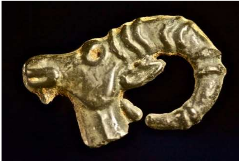
Рис. 5. Обособленная голова козла из Белогорского района

бляшке и поясе из Зивие, что, учитывая определенную стилизацию крымских изображений, позволяет отнести их к периоду не позднее кон. VI в. до н.э.