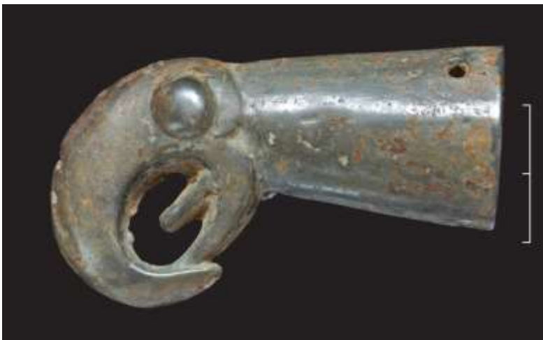
Рис. 6. Бутероль с горного массива Кубалач, сочетающая в себе черты кавказских наконечников ножен и бутеролей типа «Репяховатая Могила»

К первой группе относятся бутероли, оформленные в виде головы хищной птицы, а также уникальный образ козы с козленком. Лишь в Крыму встречены два различных типа бутеролей – Кавказский и тип «Репяховатая Могила» 31 . При этом одна из бутеролей может быть рассмотрена как переходный вариант от кавказского типа (округлая форма головки, нижняя часть которой существенно выходит за границу втулки) к типу «Репяховатая Могила» (намечающаяся вытянутость головки как продолжения формы втулки, очень массивный хорошо выделенный клюв) (рис. 2, б; 6). Бутероли типа «Репяховатая Могила» (рис. 2, 4,5; 7) обнаружены только на территории Причерноморской Степи и Лесостепи, на Кавказе они пока не встречены. Вполне допустимо, что именно Крым стал территорией формирования новой стилистики бутеролей.