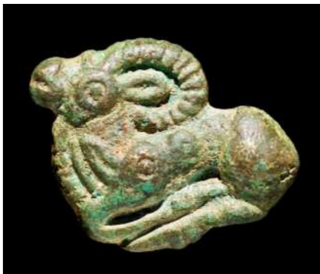
Рис. 4. Двухфигурная композиция козы с козленком (?) из окрестностей Зуи-Ароматного