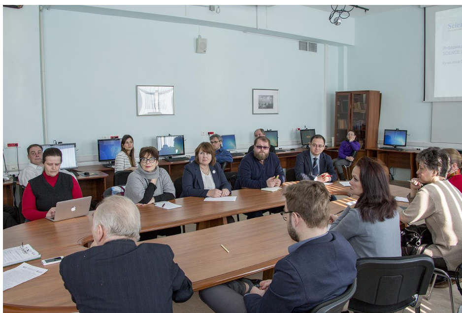
Рис.4. Участники научно-практического семинара