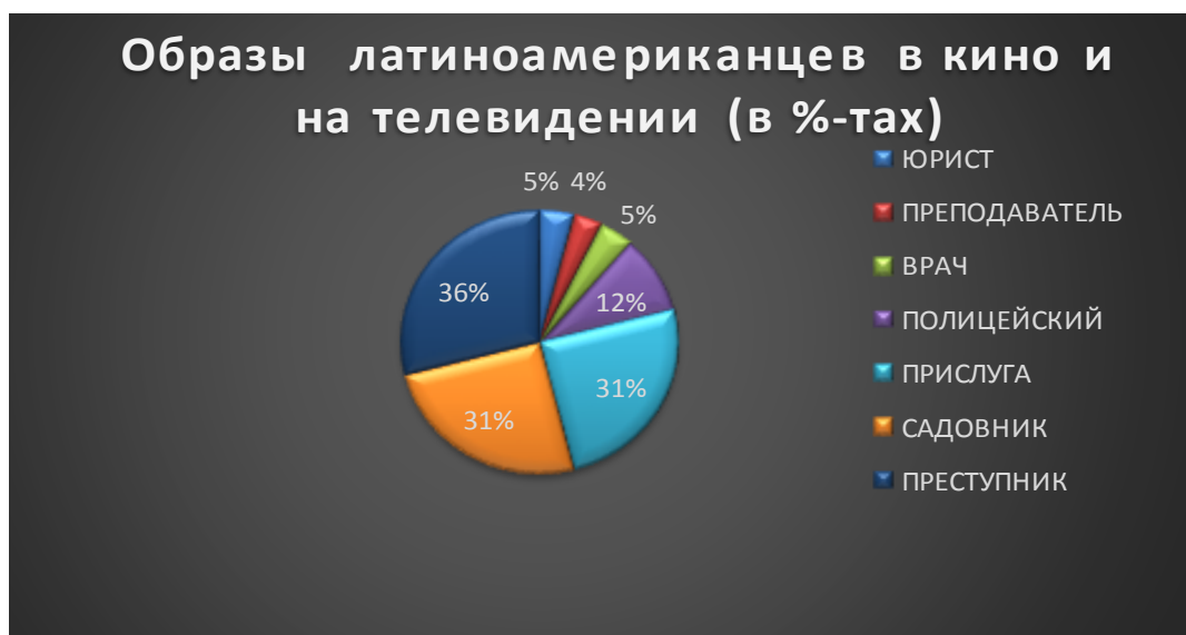
Рис. 2. Образы латиноамериканцев в кино и на телевидении (в %-тах)

Далее представлены данные проведенного опроса о самых распространенных образах латиноамериканцев в кино и на телевидении (см. рисунок 2)