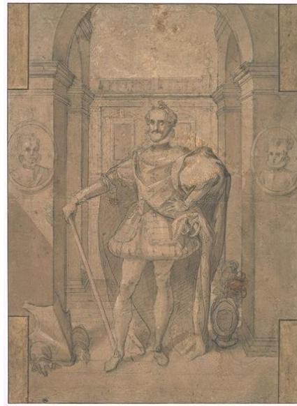
Рис.8. Жакоб Бюнель, Туссен Дюбрей. Портрет Генриха IV и его детей. 1607.

На картине «Дике приглашает Франкуса на пир в присутствии Хианты и Климены» Франкус также изображён опирающимся на длинную трость, похожую на скипетр, что делает картину кисти Дюбрея отдалённым подражанием жанру парадного портрета, а также в очередной раз сближает образы троянца и Генриха IV.