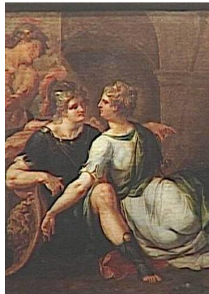
Рис. 12. Амбруаз Дюбуа. Теаген встречается Хариклею в пещере. Фрагмент. Около 1610 г.