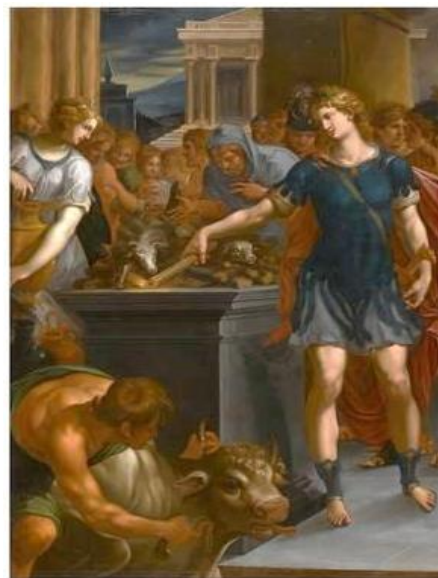
Рис. 14. Неизвестный художник, копия с оригинала Амбруаза Дюбуа. Теаген зажигает огонь на алтаре с помощью факела Хариклеи. Около 1610 г. Henri IV à Fontainebleau. Un temps de splendeur. Exposition. Collectif des auteurs. Château de Fontainebleau. Paris, Réunion des musées nationaux, 2010. P. 109.