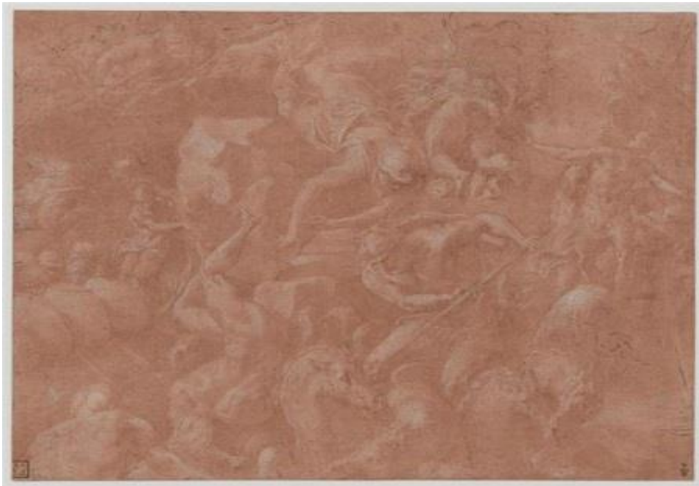
Рис.2. Франческо Приматиччо. Нептун начинает грозу против кораблей Улисса. 1550 г.

Появление в центре рисунка Нептуна с трезубцем свидетельствует о том, что иконография сюжета о кораблекрушении, возможно, была заимствована Дюбреем с картины художника Первой школы Фонтенбло Франческо Приматиччо, который около 1550 г. для галереи Улисса в замке Фонтенбло создал работу «Нептун начинает грозу против кораблей Улисса» (Рис. 2).