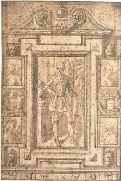
Рис.7. Жакоб Бюнель. Модель трюмо с инициалом Генриха IV. Последняя четверть XVI в.- первая четверть XVII в. База данных «Джоконда»

Подобный образ властного правителя представлен и на парадных портретах Генриха IV. Так, на эскизах «Модель трюмо с инициалом Генриха IV» (Рис. 7 8 ) и «Портрет Генриха IV и его детей» (Рис. 8 9 ), исполненных Туссенем Дюбреем и Жакобом Бюнелем для парадных портретов короля, Генрих IV показан опирающимся на скипетр, что говорит о его особом королевском достоинстве.