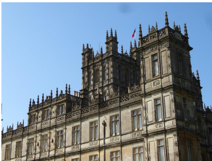
Рис.2. Хайклер-касл, южный фасад. Современный вид.

В 1855 году Чарльз Бэрри несколько раз писал четвёртому графу Карнарвону по поводу системы водоснабжения в Хайклере; 19 декабря 1855 года лорд Карнарвон оплатил выставленный Бэрри чек 8 . Решение продолжить строительство, по всей видимости, созрело у молодого графа ещё раньше – в 1854 году он составил список, где перечислил планы Чарльза Бэрри, оставшиеся у него в старой папке и на данный момент сохранившиеся лишь частично 9 . Однако до 1860-х годов нет никакой информации о том, что молодой лорд Карнарвон заказывал кому-либо новые проекты. В 1860-м году Чарльз Бэрри умер, и, скорее всего, именно по его рекомендации лорд Карнарвон выбрал в качестве нового архитектора именно Томаса Эллома, у которого, ко всему прочему, уже был опыт работы в Хайклере.