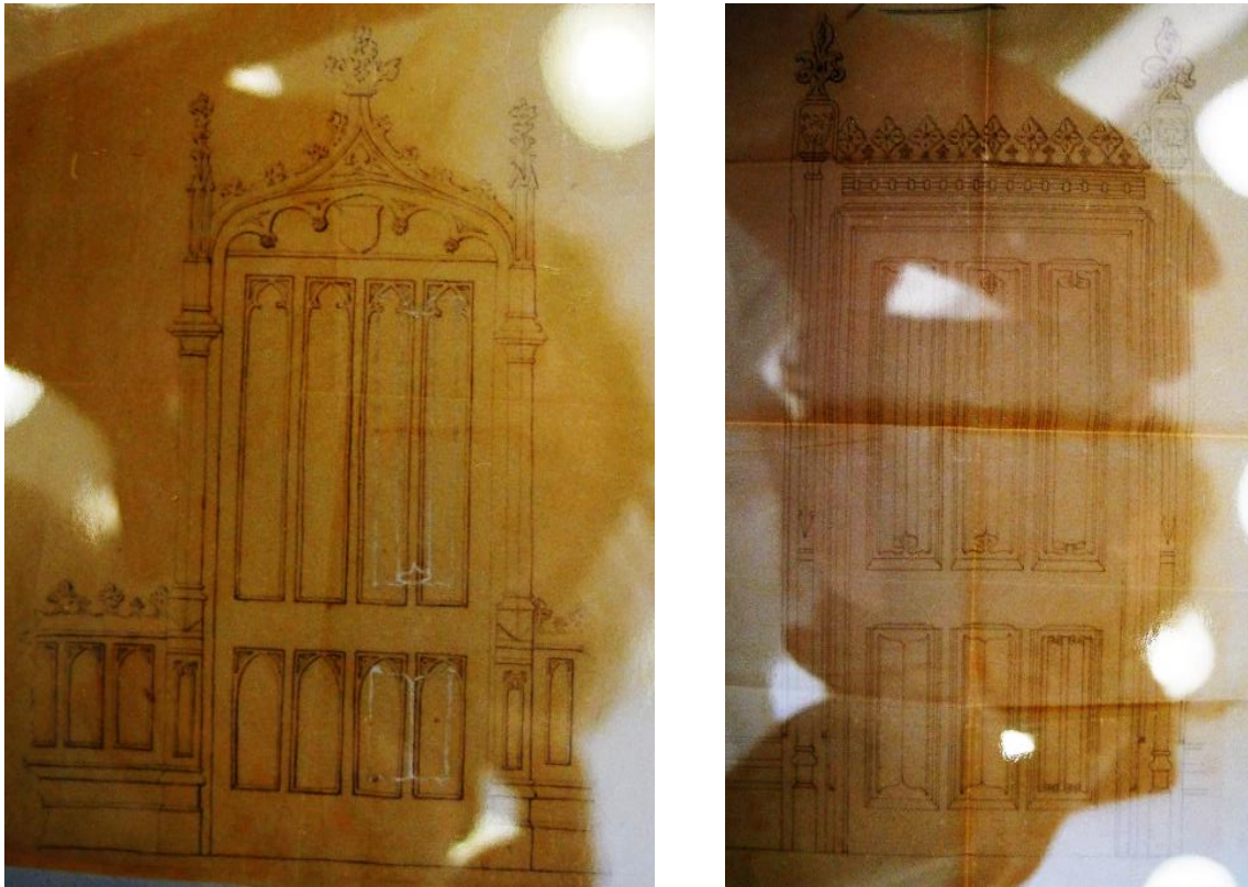
Рис.3. Двери Хайклер-касл (проекты); не атрибутированы. «Highlere architectural plans», том 2; фотокопия с оригинальных проектов; оригиналы находятся в архивах поместья Хайклер

Так как местонахождение финальных проектов Бэрри на данный момент неизвестно, сложно судить о том, насколько Эллом изменен внутреннюю структуру помещений; однако к уже имеющимся наработкам Бэрри он отнёсся максимально бережно. Об этом можно заключить по гипсовой лепнине гостевых спален, которая была выполнена в точности так, как её задумывал Бэрри – сохранился его план на прозрачной бумаге, с прорисованными потолками и вариантами лепных гирек на полях. Тем не менее, решение, предложенное Эллом для Салона, явно свидетельствует о том, что с 1840-х годов неоготика как стиль прошла определённую эволюцию. Стали доступны новые материалы – листовое стекло и сталь, а творчество Джозефа Пэкстона изменило представление об их художественных возможностях. Если ещё в 1850-е годы стеклометаллические перекрытия в усадебных домах были ещё определённого рода диковинкой, то к 1860-м годам они уже получили достаточно большое распространение.