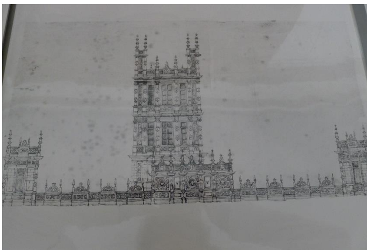
Рис.1. Хайклер-касл, южный фасад; не атрибутирован. «Highclere architectural plans», том 2, фотокопия; оригинал находится в архивах поместья Хайклер (Разрешение на копирование архивных материалов предоставлено сэром Джорджем Гербертом, восьмым графом Карнарвоном, в апреле 2018 года.)