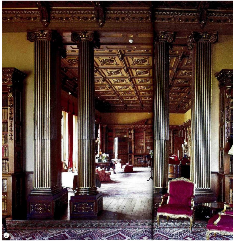
Рис.8. Томас Эллом. Двойная библиотека замка Хайклер. 1860-е гг.