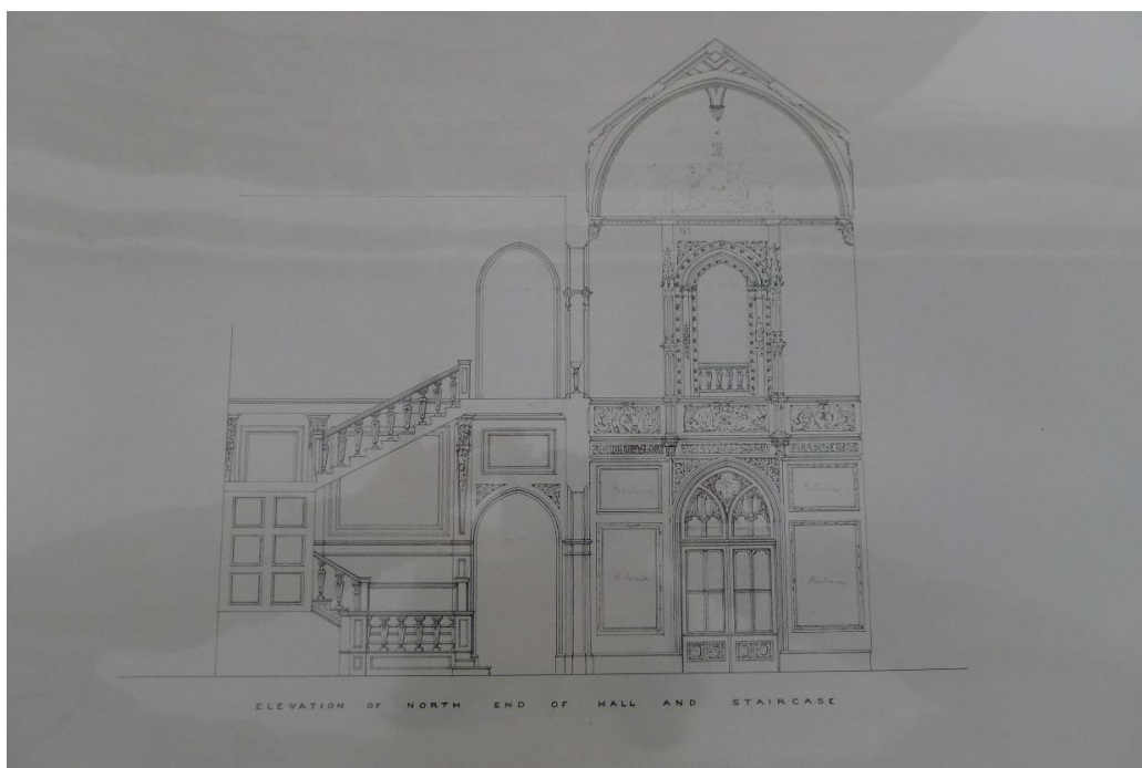
Рис.4. Томас Эллом. Предварительный проект Салона и Дубовой лестницы (северная сторона). 1860-е гг. «Highlere architectural plans», том 2; фотокопия; оригинал находится в архивах поместья Хайклер