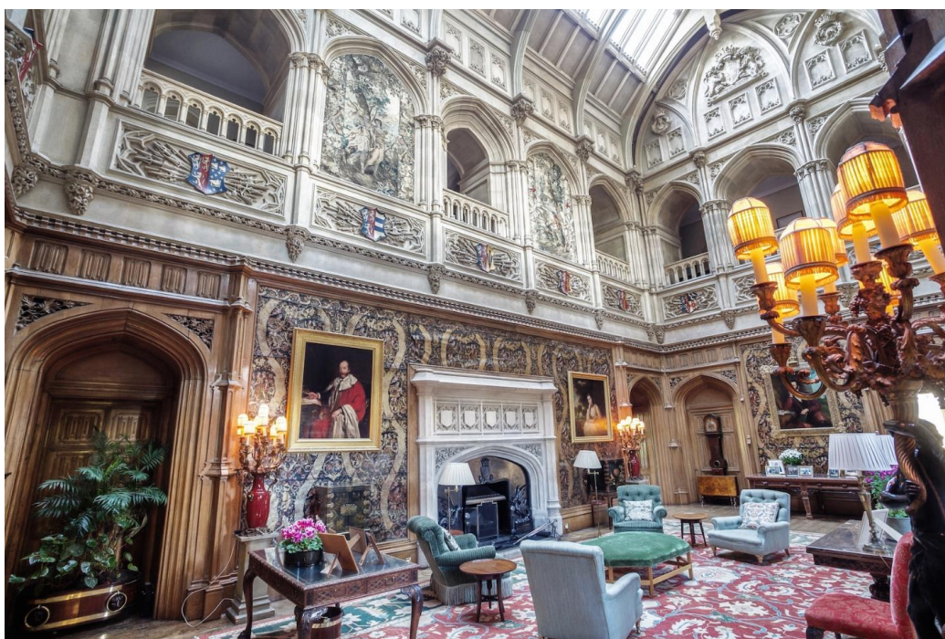
Рис.5. Томас Эллом. Большой зал («Салон») замка Хайклер, 1860-е гг.