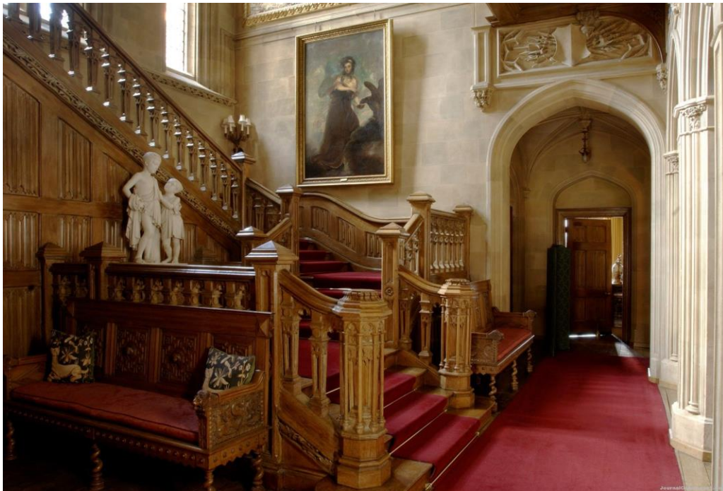
Рис.6. Томас Эллом. Дубовая лестница замка Хайклер, 1860-е гг.