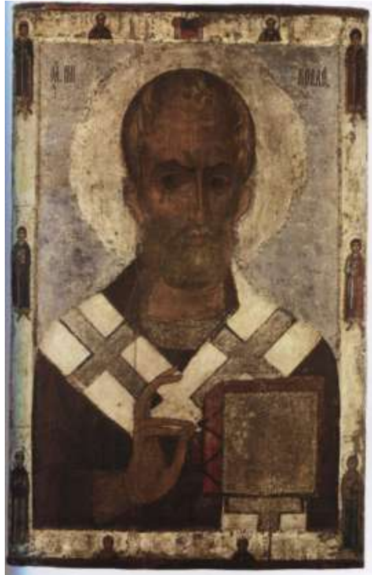
Ил.3. Св. Николай, с избранными святыми. Конец XII – начало XIII в. Новгородская икона. Была в Новодевичьем монастыре в Москве. ГТГ.

В первой трети XVI в. близ границ тогдашней Москвы был основан Ново-Девичий монастырь, где в 1526 г. был построен храм во имя иконы Богоматери Одигитрии. Именно в этот монастырь попала привезённая из Новгорода икона «Св. Николай», со святыми на полях (ГТГ) 4 . Она происходит, по всей вероятности, из одной из двух древних новгородских Церквей – «на Дворище» или «на Городище» посвящённых св. Николаю и построенных в XII в. под покровительством князей.