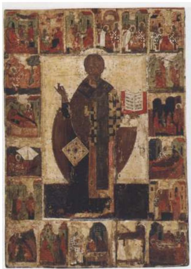
Ил.16. Св. Николай, с житием. Начала XV в. Из Вяжицкого монастыря в Новгороде. Успенский собор Московского Кремля

ГТГ). Одна – это «Спас Эммануил, с двумя архангелами», конца XII в. 30 . Другая – традиционный «Деисусный чин», с Христом, Богородицей и Иоанном Предтечей, возможно, самого начала XIII в. 31 . Каждая из этих двух икон, имеющих специфический горизонтальный формат, вероятно, украшала древнюю алтарную преграду, которая в XII в. была ещё невысокой. Обе эти иконы пользовались большим почитанием в Московском Кремле, они показаны на миниатюрах, изображающих московские торжества по случаю избрания на престол царя Михаила Фёдоровича, первого царя из династии Романовых, в 1613 г. 32 .