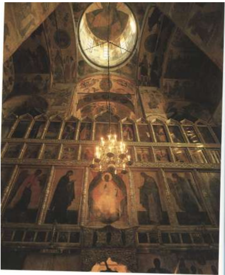
Ил.4. Благовещенский собор Московского Кремля. Иконостас. По кн.: Качалова И.Я., Маясова Н.А., Щенникова Л.А. Благовещенский собор Московского Кремля. К 500-летию уникального памятника русской культуры. М., 1990

иконы деисусного и праздничного рядов не могли поместиться в небольшом храме, стоявшем в 1405 г. Вопрос о происхождении деисусного и праздничного ярусов иконостаса Благовещенского собора остаётся открытым