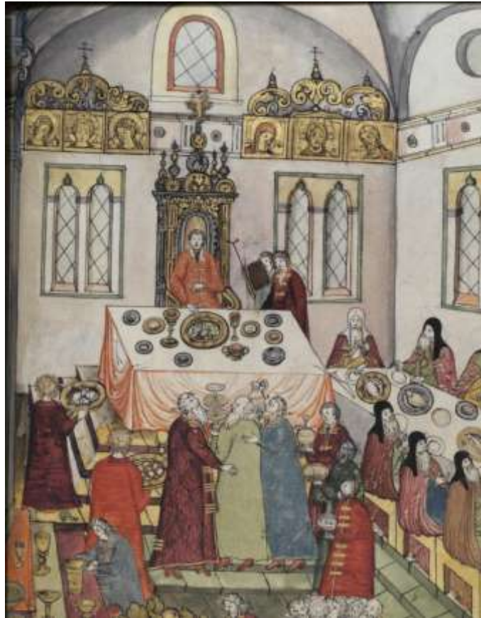
Ил.19 Царский пир в Кремле в 1613 г.

Миниатюра из «Книги избрания на превысочайший престол...». Деталь.