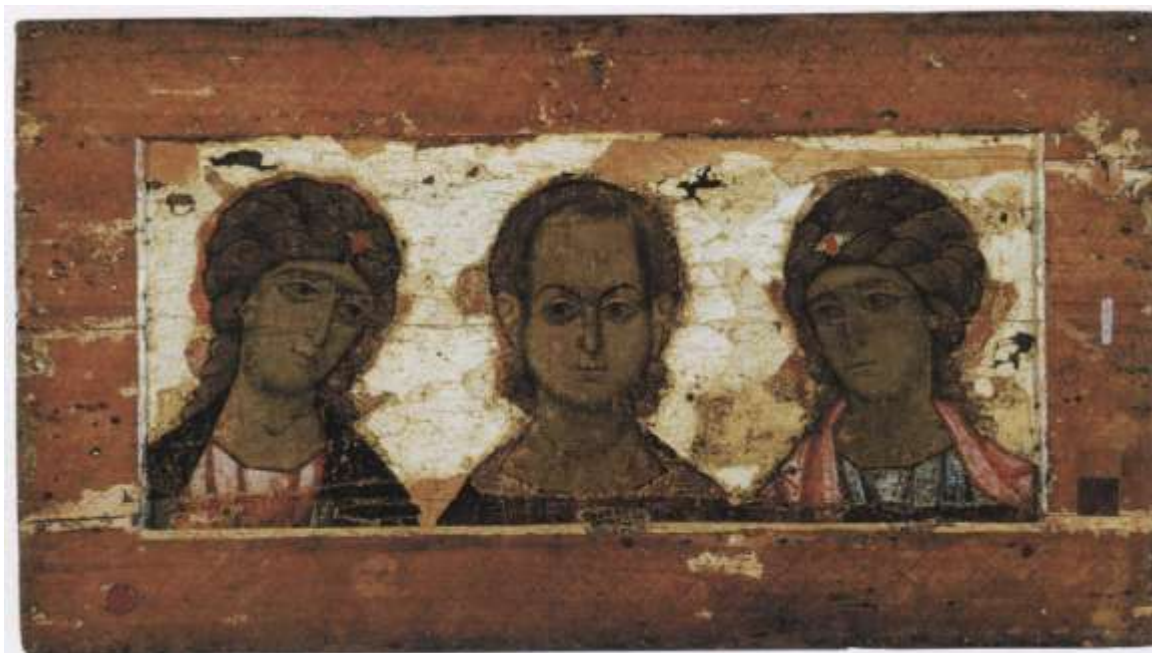
Ил.17. Спас Эммануил, с двумя архангелами. Последняя треть XII в. ГТГ