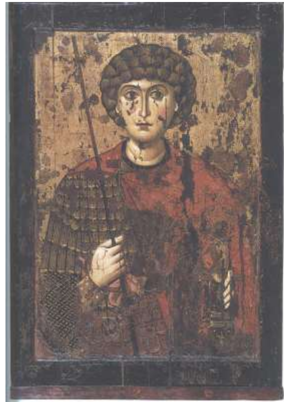
Ил.8. Св. Георгий. Обратная сторона иконы. Живопись XI в.

После 1570 г., когда Новгород подвергся жестокому разорению от войск Ивана Грозного, в Москву был направлен новый поток древних новгородских икон. Многие из них зафиксированы в самой ранней из сохранившихся описей Успенского собора, составленной в начале XVII в. 14 Но лишь в редких случаях нам удаётся узнать, когда они сюда в точности попали. Вот их перечень по хронологии создания самих икон.