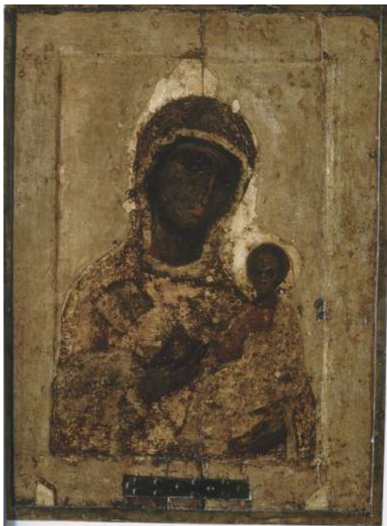
Ил.13. Богоматерь Корсунская. Вторая половина XIII в. Двусторонняя икона. Успенский собор Московского Кремля

Назовём также две иконы XIV в. с изображением Спаса на престоле», в которых варьируется мотив из более ранней иконы «Спас Златая риза»: жест Христа, указывающего на раскрытую книгу Евангелия. Одна из них (сейчас в Благовещенском соборе Кремля), написана в 1337 г. для новгородского архиепископа Моисея. Её живопись в значительной мере переписана в XVI в., но с полным сохранением всей композиции 26 . Другая, в Успенском соборе, создана в конце XIV в., но от первоначальной живописи сохранилось только изображение лика 27 . Вывоз из Новгорода этих двух икон, как и памятника XI в., послужившего для них образцом (см. илл. 6), свидетельствует о большом интересе Москвы к своеобразной новгородской иконографии Христа на престоле. Однако в Новгороде