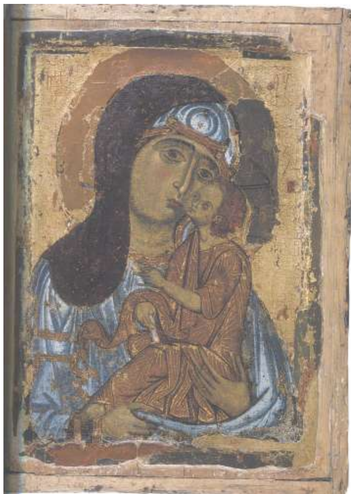
Ил. 12. Богоматерь с Младенцем. Новгородская икона конца XII в. Успенский собор Московского Кремля

Из произведений XIII в. привлекает внимание двусторонняя икона с изображением Христа и Богоматери с Младенцем. К позднему времени – к XVIII в. - восходит легенда, будто икона является «корсунской», т.е. имеет византийское происхождение и попала на Русь из Херсонеса при князе Владимире Святославиче 25 . Некоторое упрощение форм, в сравнении с византийскими произведениями, а также подчёркнутая суровость образа позволяют предположить русское (скорее всего новгородское) происхождение этой иконы, написанной под впечатлением от византийской живописи.