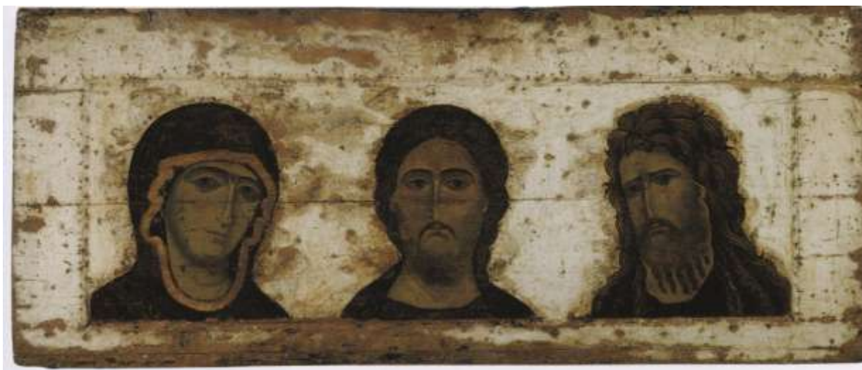
Ил.18. Деисусный чин. Конец XII – начало XIII в. ГТГ