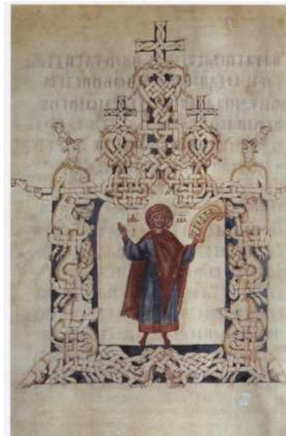
Ил.22. Пророк Давид. Миниатюра «Псалтири Ивана Грозного». Новгород, последняя четверть XIV в. РГБ. По кн.: Вздорнов Г.И. Феофан Грек. Творческое наследие. М., 1983.

Следует обратить внимание на то, что подавляющее большинство перемещённых в XVI в. произведений - новгородские. Очевидно, задачей описанных мероприятий было не только подчеркнуть статус Москвы как политического и религиозного центра страны, но и снизить культурно-политическое значение Новгорода.