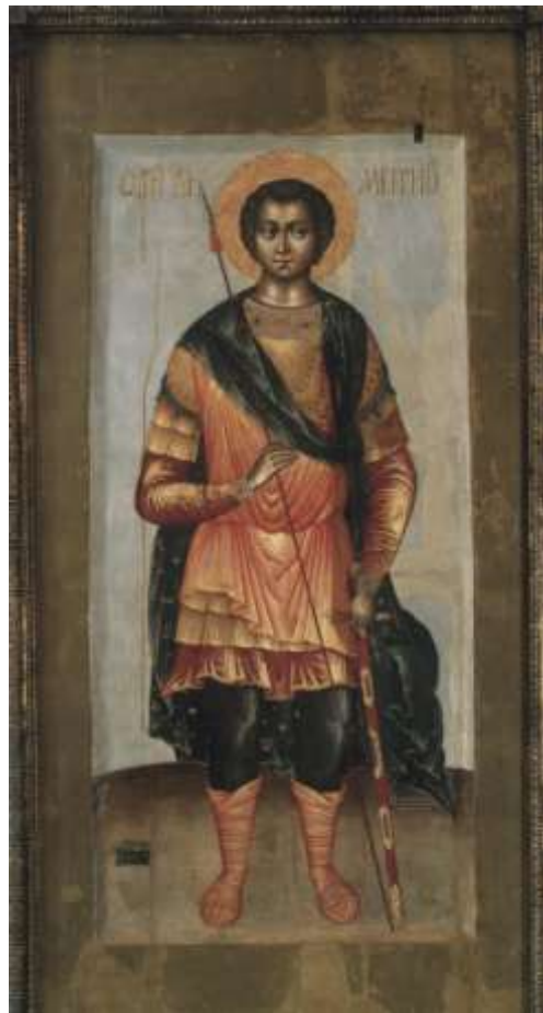
Ил.23. Св. Димитрий Солунский. Живопись мастера Кирилла Уланова, 1701 г., на византийской доске XII в.

Константинополя в Киев, затем в 1155 г. – из Киева во Владимир, затем в 1395 г. из Владимира в Москву – в Успенский собор 38 .