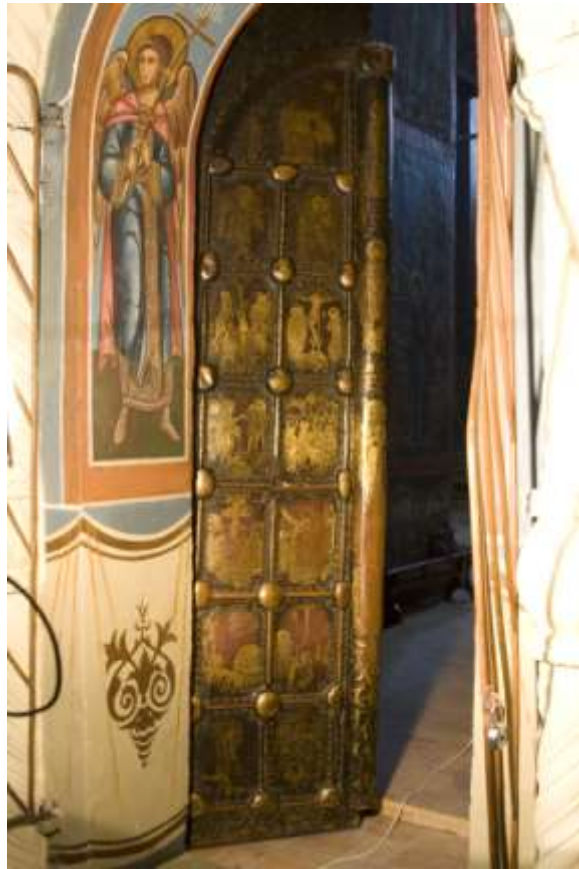
Ил 20. Храмовые врата новгородского Софийского собора («Васильевские врата»). 1336 г. Троицкий собор в Александрове

Кроме того, известны иллюминированные рукописи в прекрасных окладах, вывезенные из Новгорода. Это, прежде всего, «Мстиславово Евангелие» начала XII в. (ГИМ, Син. 1203), которое хранилось в уже упоминавшейся церкви Благовещения на Городище и было отправлено в Архангельский собор Московского Кремля 35 . При этом у него был отремонтирован драгоценный оклад 36 . Вторая рукопись – это Псалтирь последней четверти XIV в., РГБ, ф. 304, Троицк. III, № 7 (М. 8662), которая, вероятно, привлекла внимание своими замечательными миниатюрами, 37 . Псалтирь была отправлена в знаменитый Троице-Сергиев монастырь и получила условное название «Псалтирь Ивана Грозного».