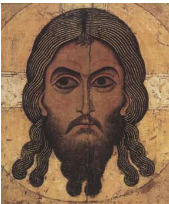
Ил.9. Спас Нерукотворный. Лицевая сторона двусторонней новгородской иконы. 1170-е гг. Из церкви Св. Образа в Новгороде. ГТГ

Следующая по хронологии – двусторонняя икона со «Спасом Нерукотворным и «Поклонением Кресту» на обороте (ГТГ) 16 . Как показывает стиль, она исполнена двумя художниками, принимавшими участие и в росписи церкви Св. Георгия в Старой Ладогe, близ Новгорода 17 . Эти фрески в последнее время удалось, по данным стиля, датировать 1170-ми гг. 18 К тому же времени относится и эта икона, одна из лучших в русско-византийском наследии XII в. Предполагается, что она была исполнена для новгородской церкви, посвящённой Нерукотворному Образу 19 .