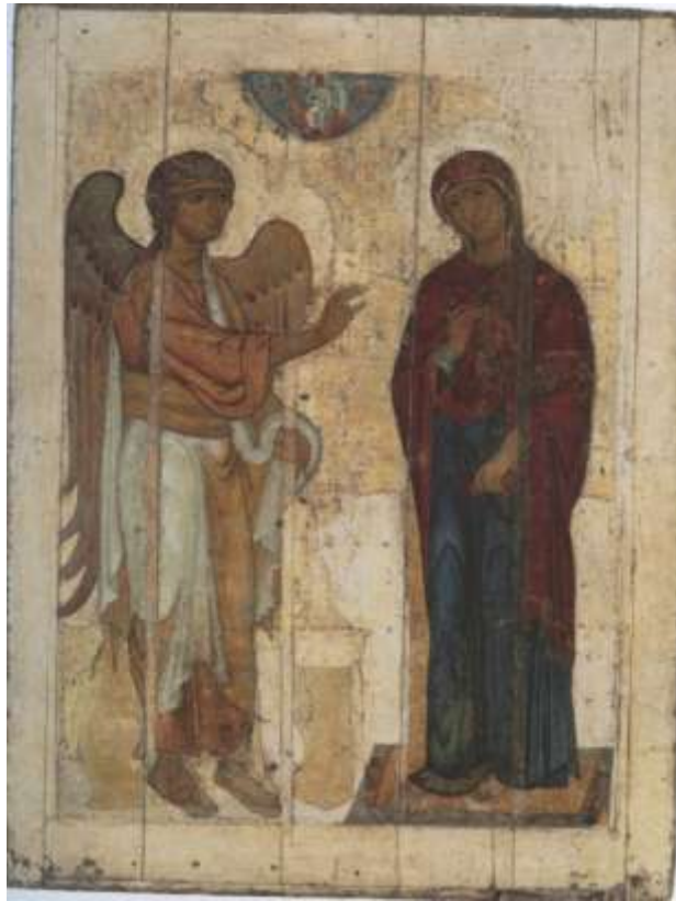
Ил.5. Благовещение. Начало – первая треть XII в. Новгородская икона. Из Георгиевского собора Юрьева монастыря в Новгороде. ГТГ

иконографический вариант, где зримо представлено Воплощение Христа в лоне Богородицы и были изображены все три лица Святой Троицы: Бог Отец, Бог Сын и Бог Дух Святой (изображение его символа - голубя не сохранилось). Эта иконография привлекла внимание дьяка Ивана Висковатого, участника проходивших в Москве в 1553 г богословских споров. 8 Поэтому думают, что «Благовещение» уже находилось в это время в Москве, но что его окончательное перемещение в столицу состоялось в 1561 г. 9 Древнейшие из сохранившихся Описей Успенского собора Московского Кремля, относящиеся к 1627 и 1638 гг., фиксируют данную икону как находящуюся в этом храме 10 . Однако есть предположение, что первоначально икона поступила в Благовещенский собор, где служила храмовым образом, и лишь впоследствии была перемещена в Успенский храм 11 .