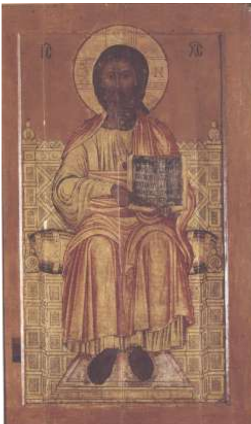
Ил.6. Спас на престоле («Спас Златая риза»). Живопись XVII в. на доске XI в. Успенский собор Московского Кремля

В 1561 г. 12 из Новгорода привезли, вместе с «Благовещением», огромную икону «Спас на престоле» (242 x 148 см, Успенский собор Московского Кремля), которая имеет дополнительные названия, и одно из них - «Спас Златая риза», из-за драгоценного оклада, который не сохранился до наших дней 13 .