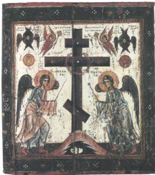
Ил.10. Поклонение Кресту. Обратная сторона иконы.