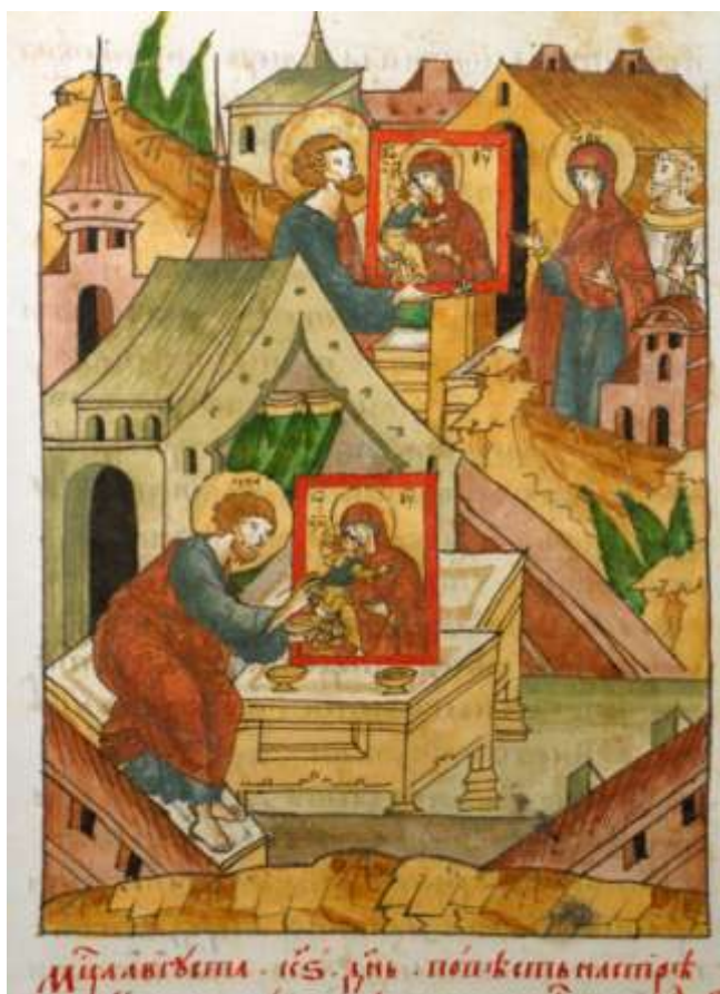
Ил.24. Св. апостол и евангелист Лука пишет икону Богоматери Владимирской. Миниатюра Лицевого летописного свода. 1568-1576 гг. Второй Остермановский том. БАН, 31.7.30-2. Л. 467.

По кн.: Лицевой летописный свод. Факсимильное издание рукописи XVI века в 10 книгах. М., 2006. Кн. 7. Ч. 2. Л. 465.