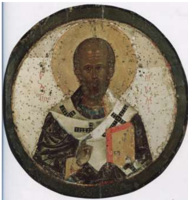
Ил.2. Св. Николай. Икона – «круглый образ. XIV и XVI вв. Новгородский музей-заповедник. По кн.: Иконы Великого Новгорода XI - XVI века.. М., 2008.

Икона примечательна своей редкой круглой формой, которая восходит к античности, но встречается в изображениях икон в византийских миниатюрах IX в. в монументальных росписях XI-XII вв., где изображаются висящие в храме иконы, а также среди изделий из керамики, камня, металла. Среди икон византийского мира, написанных красками на дереве, такие произведения не сохранились, за исключением копий упомянутой древней новгородской иконы.