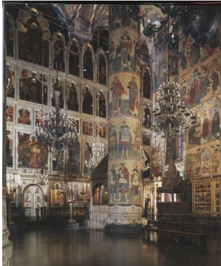
Ил.1. Успенский собор Московского Кремля. Интерьер

Некоторые из привезённых в Москву произведений не сохранились до наших дней: они сгорели в многочисленных пожарах или пропали по другим причинам. Другие были изъяты при советской власти из московских церквей и переданы в государственные музеи (более всего – в Третьяковскую галерею). Но их значительная доля до сих пор остаётся в храмах Московского Кремля. Посетители, осматривая храмы Кремля, не всегда задаются вопросом, каким путём, например, в Успенский собор, построенный в 1475-1479 гг., попали эти древние иконы, в том числе XI и XII вв.