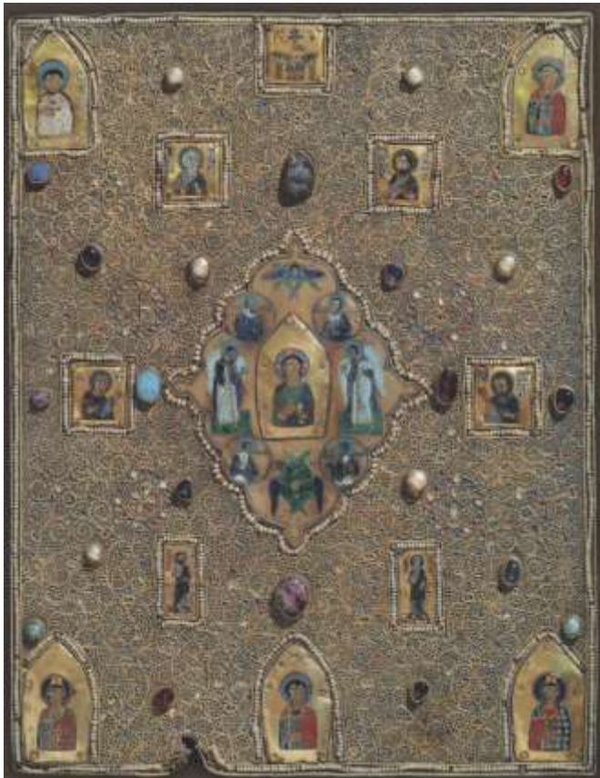
Ил.21. Мстиславо Евангелие. Оклад XVI в. для рукописи начала XII в., с древними эмалями. ГИМ