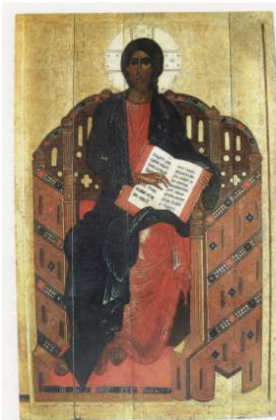
Ил.14. Спас на престоле. 1337 г. (с поновлениями). Икона новгородского архиепископа Моисея. Благовещенский собор Московского Кремля.

оставались и другие памятники с аналогичными изображениями, например, икона 1362 г., в Софийском соборе, исполненная по заказу архиепископа Моисея или, более вероятно, Алексея 28 .