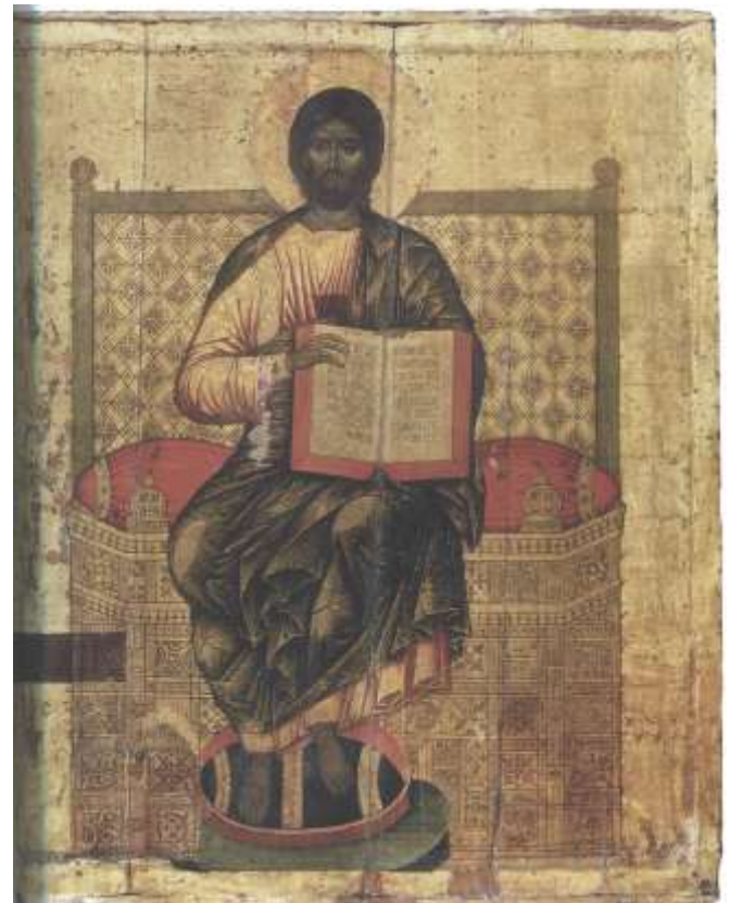
Ил.15. Спас на престоле. Конец XIV в., с поздними переделками. Новгородская икона. Успенский собор Московского Кремля.

По кн.: Московский Кремль XIV столетия. Древние святыни и исторические памятники. М., 2009.