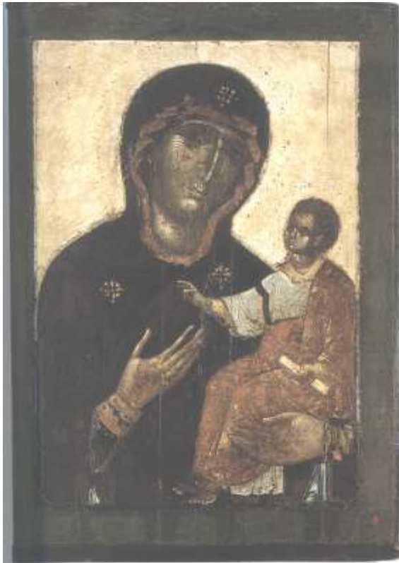
Ил.7. Богоматерь Одигитрия. Лицевая сторона двусторонней новгородской иконы. Живопись XI и XIV в. Успенский собор Московского Кремля

построен в XV в. как реплика древнейших русских церквей, и в частности, Успенского собора во Владимире.