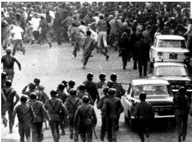
Рис.4. Разгон демонстрации в Авейру

С приходом к власти Марселу Каэтану начался период так называемой «марселистской весны». Основным лозунгом нового премьер-министра стали слова «Обновление в преемственности» (“Renovação em continuidade”) 1 . На практике сочетание обновления и преемственности выглядело так. К участию в выборах в Национальную Ассамблею в 1969 г. и в 1973 г. впервые была допущена оппозиция. В 1969 г. списку салазаровского Национального союза противостояли два списка, представлявших оппозицию. За кандидатов из Демократической избирательной комиссии проголосовало, по официальным данным, 10,3% избирателей, за кандидатов из Избирательной комиссии демократического единства – 1,5%, но ни один оппозиционный кандидат не был избран 2 . Однако среди депутатов, избранных от Национального союза, было несколько политиков, которых соратники Салазара считали «либералами» 3 . В 1973 г. единый блок оппозиционных сил отказался участвовать в «избирательном фарсе». В 1969 г. был ослаблен государственный контроль над деятельностью профсоюзов. В 1970 г. несколько профсоюзов объединились, создав Интерсиндикал, в котором преобладало политическое влияние коммунистов. Власти запретили Интерсиндикал, вплоть до революции 1974 г. он действовал нелегально. В начале апреля 1973 г. правительство разрешило провести в городе Авейру Конгресс демократической оппозиции, который прошёл легально 4–8 апреля, однако уличная демонстрация в поддержку Конгресса была жестоко разогнана полицией.