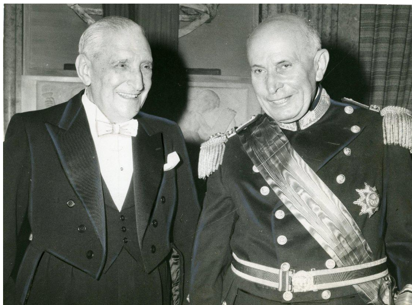
Рис.1. Премьер-министр Салазар (слева) и президент Томаш.

безраздельно принадлежала главе кабинета министров - Салазару. Генерал или адмирал в качестве главы государства нужен был диктатору для поддержания контроля над Вооружёнными Силами.