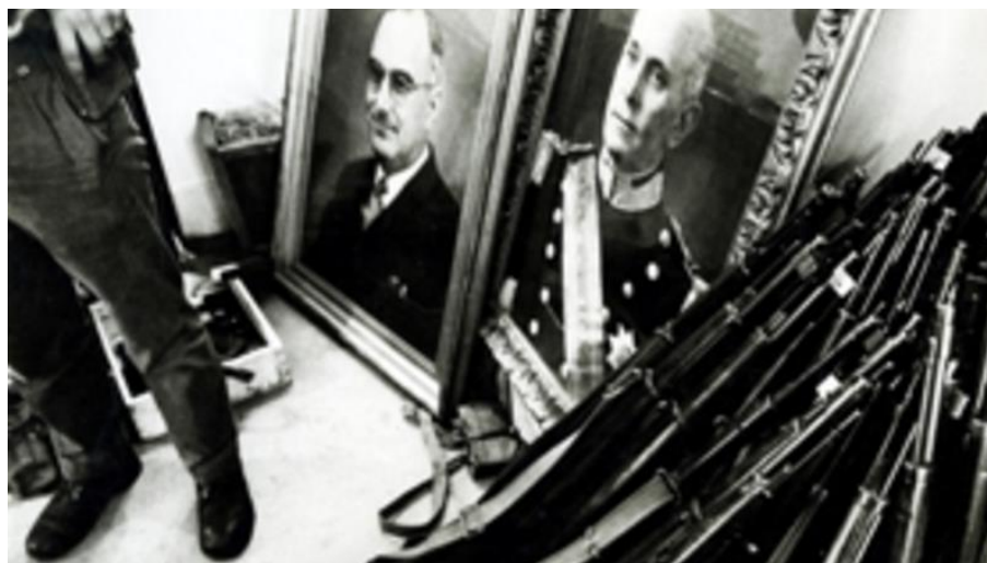
Рис.5. Движение Вооружённых Сил (ДВС) свергло власть Каэтану – Томаша