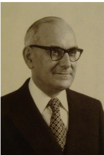
Рис.3. Марселу Каэтану

Однако в сентябре 1968 г. противники режима не смогли перехватить инициативу у правящих кругов. Португальская оппозиция была расколота. Во время кампании по выборам президента в 1958 г. генералу Умберту Делгаду удалось объединить вокруг своей кандидатуры все силы оппозиции, однако после неизбежного в условиях диктатуры поражения оппозиционного кандидата этот союз распался. После опасной для режима президентской кампании 1958 г. прямые выборы президента были заменены косвенными. Сам Умберту Делгаду был убит агентами политической полиции в феврале 1965 г. Коммунистическая партия Португалии, бывшая на протяжении всего периода диктатуры организатором забастовок промышленных и сельскохозяйственных рабочих, несла тяжёлые потери в результате постоянных репрессий. В стране существовали группировки социалистической направленности, но единая Португальская социалистическая партия была образована только в 1973 г. Либеральная оппозиция с надеждой встретила назначение Каэтану на пост премьер-министра.