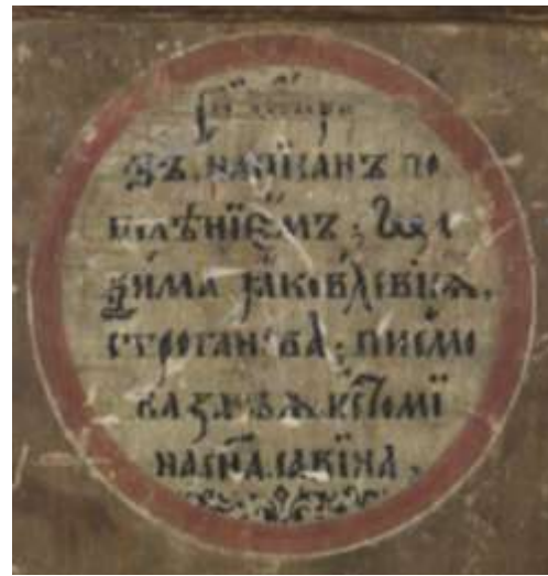
Ил.8. Благовещение. 1610-е гг. Назарий Истомир Савин. На обороте – владельческая надпись Максима Яковлевича Строганова.

Бывшее собрание М.Е. Елизаветина