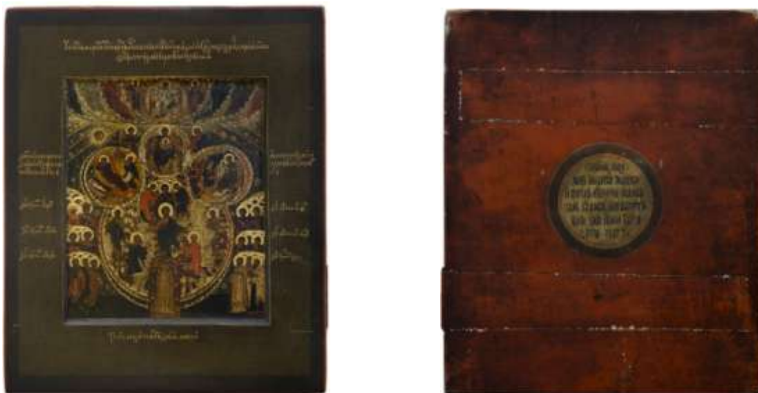
Ил.1. «Что Тя наречем, обрадованная...». Икона XVII в. с поновлениями 1809/1810 г. Бывшее собрание М.Е. Елизаветина

На некоторых древних иконах, купленных и поновленных собирателями-старообрядцами в начале XIX века и позже, были сделаны владельческие надписи, размещенные на загрунтованных и выкрашенных оборотах в специальных медальонах. В последние годы было выявлено большое количество таких текстов, относящихся к первой половине XIX столетия.