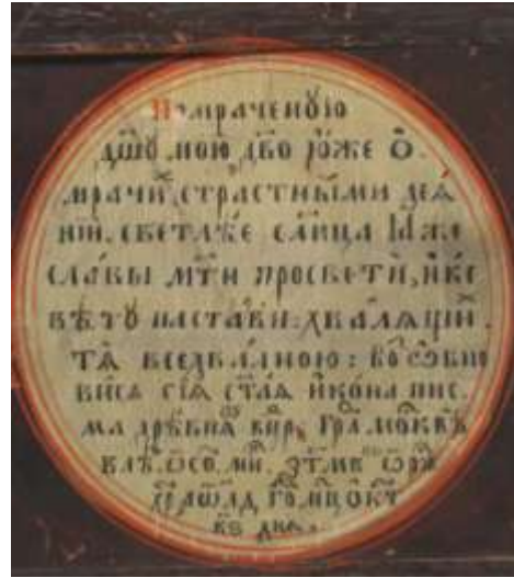
Ил.5. Богоматерь Неопалимая купина. Икона XVII в., поновленная в 1834 г. Частное собрание

Почти все они начинаются церковным песнопением, относящимся к сюжету на лицевой стороне, а имя владельца в них отсутствует. Тем не менее, все тексты содержат сведения о «возобновлении» иконы «в царствующем граде Москве» и дату этого «возобновления», то есть реставрации. Кроме того, отсутствие имени владельца компенсируется попыткой краткой атрибуции произведения: указывается, что оно «письма древнего», «письма греческого» или, чаще всего, «письма строгановского». Вне зависимости от того, насколько верны такие характеристики, они превращаются в один из главных признаков иконы как конкретного материального объекта, а сами надписи начинают напоминать этикетки с пояснительными текстами. Следует подчеркнуть, что все произведения с такими надписями явно находились в одном и том же старообрядческом собрании. Таким образом, и в этом случае можно говорить об определенном замысле владельца и отработанном способе оформления принадлежавших ему икон.