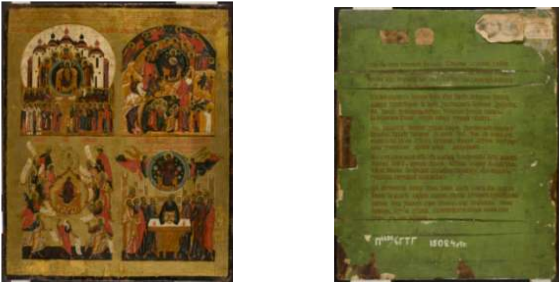
Ил.7. Четырехчастная икона. Вторая половина XVIв., с поновлениями XIX в. Из собрания Мараевых в Серпухове. Государственная Третьяковская галерея