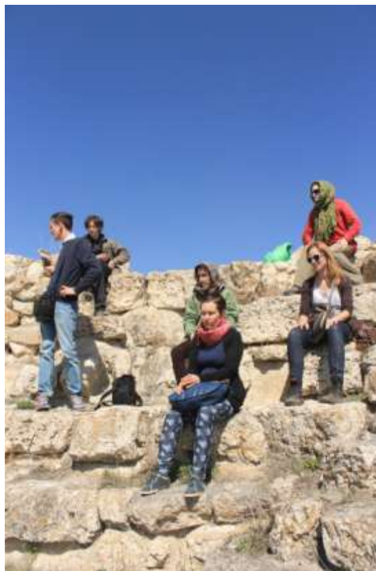
Ил.5. На ступенях театра (фото А. Меденниковой. 2014 г.)