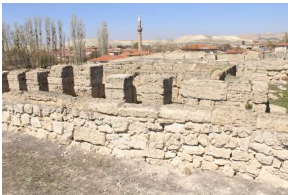
Ил.2. Храм в Пессинунте (фото А. Меденниковой. 2014 г.)