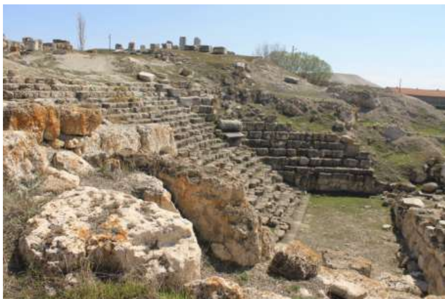
Ил.4. Театр, совмещенный с лестницей (2014 г.)