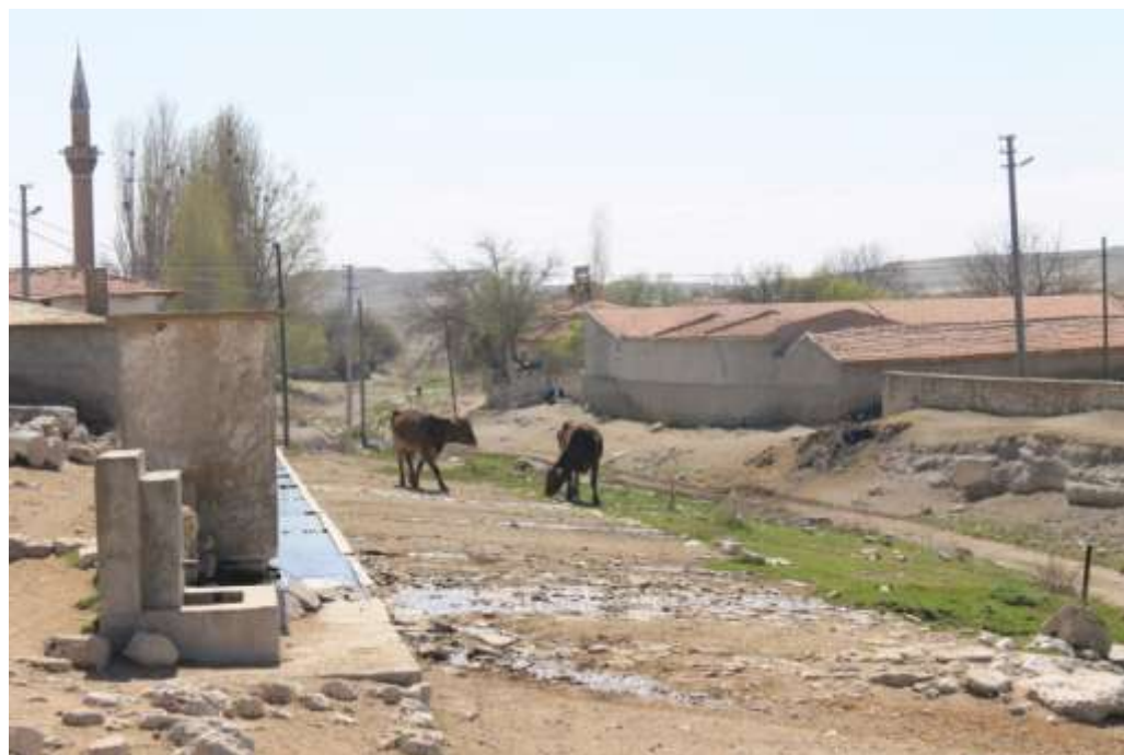
Ил.3. Пересохшее русло реки Галлос