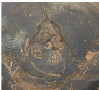
Рис. 3. Чернолаковая мисочка. Жайык-I, курган № 1/2019, погребение № 1. Уральск, Западно-Казахстанский областной центр истории и археологии.

в Ново-мусинском могильнике также подвергается сомнению 60 , хотя каких-либо оснований для этого просто не существует. Амфора была найдена в процессе регулярных раскопок, ее находка зафиксирована in situ фотографией (рис. 2, 2), приведенной в отчете, находящемся на государственном хранении в Архиве Института Археологии РАН 61 . Интересно, что во всех случаях речь идет только об амфорах Гераклеи и их фрагментах.