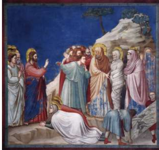
Ил.15. Джотто. Воскрешение Лазаря. Фреска капеллы Скровеньи, Падуя. Около 1306. Фрагмент

Этой повторностью предуказано такое же повторение в мистерии боговоплощения: первое явление Христа предзнаменует явление Его ученикам после воскресения.