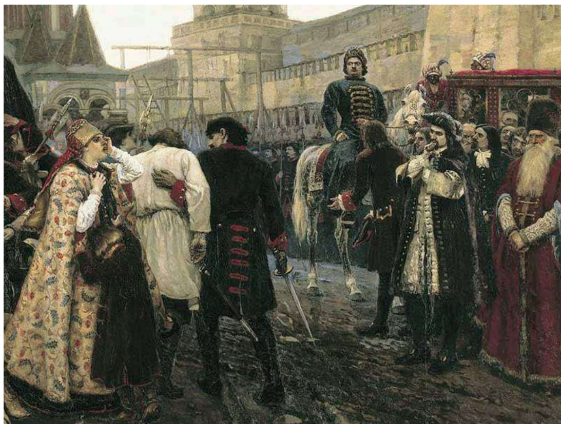
Ил.2. Василий Суриков. Утро стрелецкой казни. Фрагмент. 1881. Холст, масло. 218 x 379 см. Государственная Третьяковская галерея, Москва

Сама нечаянность «рифмовки» суриковской картины с современными ее появлению событиями конца и начала царствований, символизирует постоянную, непреходящую готовность русской истории повторить в иных обстоятельствах, костюмах и декорациях то, что изображено художником на полотне. Главным и постоянным собеседником Сурикова в процессе сочинения «Утра стрелецкой казни» была хранившаяся в Румянцевском музее картина Иванова. Суриков на свой лад воспроизвел «поединок взглядов», который у Иванова происходит между Крестителем и фарисеями.