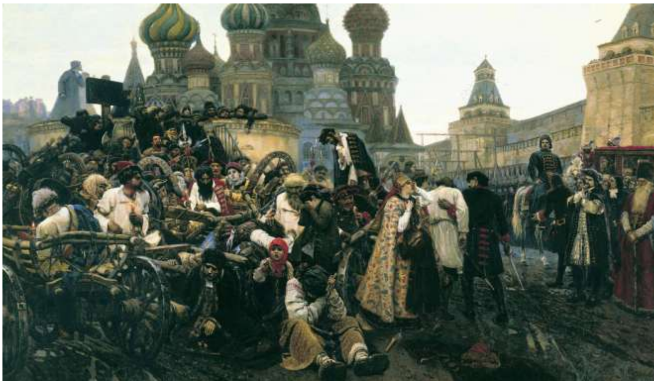
Ил.1. Василий Суриков. Утро стрелецкой казни. 1881. Холст, масло. 218 x 379 см. Государственная Третьяковская галерея, Москва 2

даже моменту рождения (год рождения 18 зеркально отображает год смерти 81), то есть знаменует Воскресение (Александр появился на свет в среду Пасхальной недели)