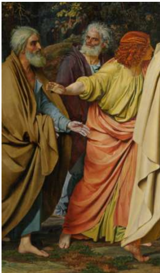
Ил.12. Александр Иванов. Явление Христа народу (Явление Мессии). Фрагмент. 1837–1857. Холст, масло. 540 x 750. Государственная Третьяковская галерея, Москва

Но если Суриков никоим образом не мог знать о том, что «выход в свет» его произведения ознаменует роковой конец одного и начало другого царствования, то с Ивановым дело обстояло как раз наоборот – он определенно знал, что его полотно, изображающее утро, начало поприща, в развязке которого маячит мученическая гибель того, кто сам олицетворяет «утро мира», что это полотно появится в начале царствования нового государя.