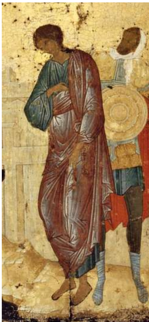
Ил.9. Дионисий. Распятие. Икона. Около 1500. Фрагмент. Государственная Третьяковская галерея, Москва

Поскольку картина Сурикова и картина Иванова, символически олицетворяют идею соотнесенности «начала» и «конца», обращает на себя внимание то обстоятельство, что сами события явления этих картин глазам русской публики как-то удивительно обрамляют начало и конец царствования Александра-Освободителя.