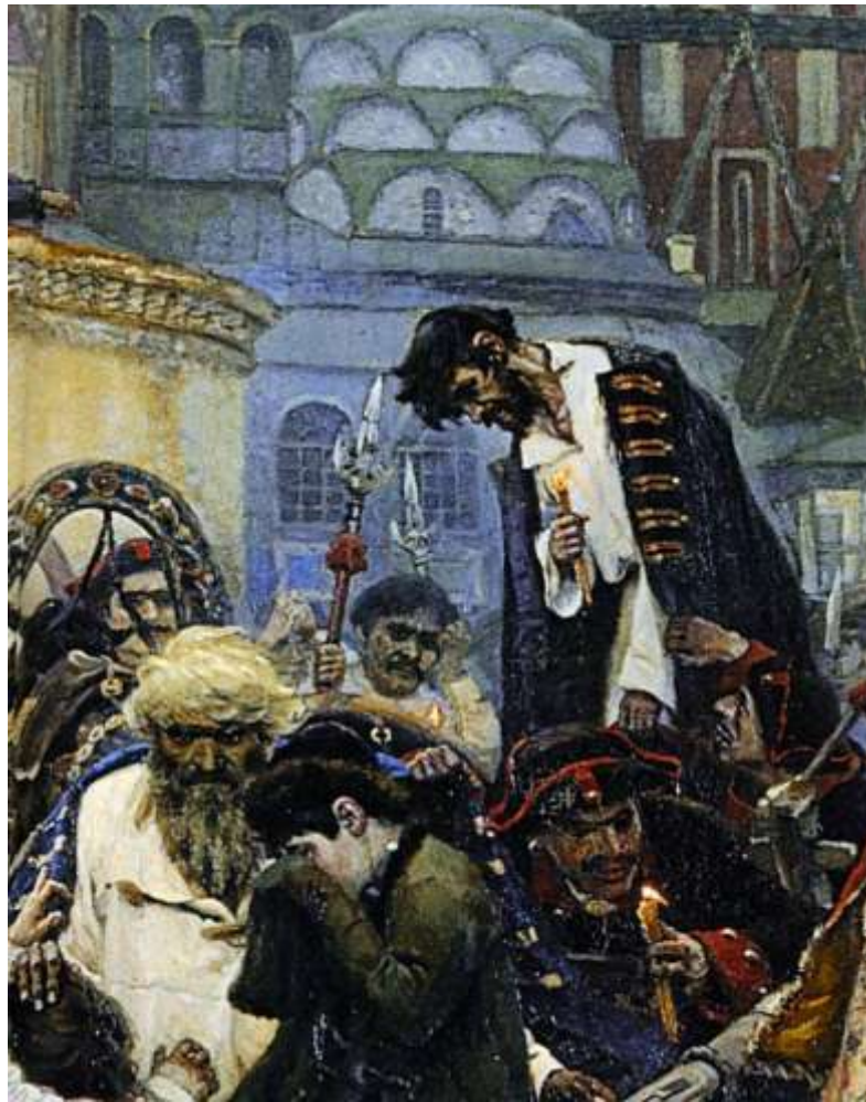
Ил.8. Василий Суриков. Утро стрелецкой казни. Фрагмент. 1881. Холст, масло. 218 х 379 см. Государственная Третьяковская галерея, Москва

При простом сопоставлении «Утра стрелецкой казни» с этим фрагментом ивановской картины и, особенно, с близким ему акварельным рисунком можно убедиться в цитатном характере фигуры стрельца, прощающего с народом, словно пребывающего во внутренней покаянной молитве, и группы преображенца и стрельца, ведомого на казнь, и фигуры стрельчихи с заломленными руками, выплескивающей свое отчаяние вовне. Так же, как у Иванова, они представляют собой эмоционально контрастный комментарий к драматургической и смысловой доминанте картины, образуемой «поединком взглядов» рыжебородого стрельца и Петра I – диалогом, который, в свою очередь, в психологическом и композиционном отношении является цитатой из ивановской картины.