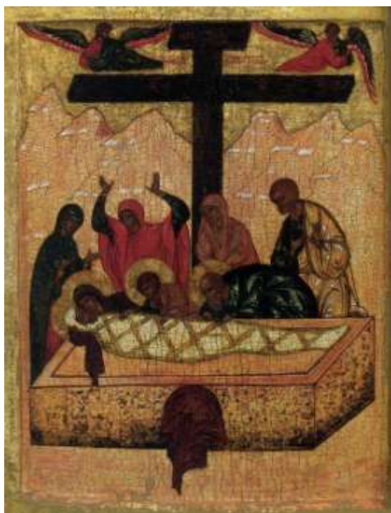
Ил.10. Положение во гроб. Икона. XVI век. Государственный исторический музей, Москва