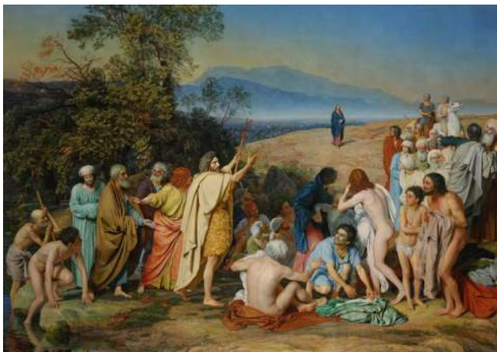
Ил.4. Александр Иванов. Явление Христа народу (Явление Мессии). 1837–1857. Холст, масло. 540 х 750. Государственная Третьяковская галерея, Москва

Рыжебородый стрелец у Сурикова явно цитирует роль Крестителя у Иванова, но взгляд стрельца направлен не прямо и параллельно плоскости холста, а по диагонали вверх и адресуется всаднику (у Сурикова это Петр на фоне кремлевской стены).