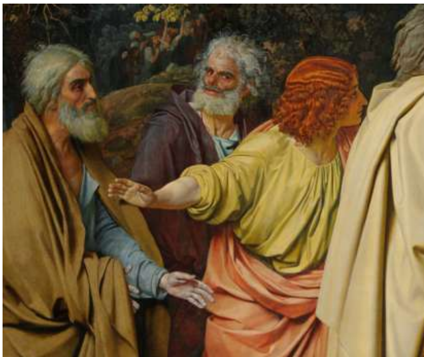
Ил.14. Александр Иванов. Явление Христа народу (Явление Мессии). Фрагмент. 1837–1857. Холст, масло. 540 x 750. Государственная Третьяковская галерея, Москва

«Моя метода – силою сравнения и сличения этюдов подвигать вперед труд», – писал он, делая при этом весьма существенное пояснение: «способ сей согласен с выбором предмета». 3 Например, в фигуре Иоанна Богослова, воспроизведен мотив фигуры того же Иоанна из падуанской фрески Джотто «Воскрешение Лазаря», где Иоанн впрямую обращен к воскресшему.