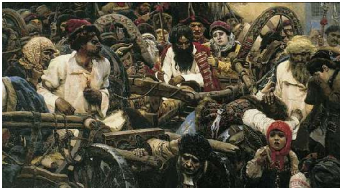
Ил.3. Василий Суриков. Утро стрелецкой казни. Фрагмент. 1881. Холст, масло. 218 х 379 см. Государственная Третьяковская галерея, Москва

Рыжебородый стрелец у Сурикова явно цитирует роль Крестителя у Иванова, но взгляд стрельца направлен не прямо и параллельно плоскости холста, а по диагонали вверх и адресуется всаднику (у Сурикова это Петр на фоне кремлевской стены).