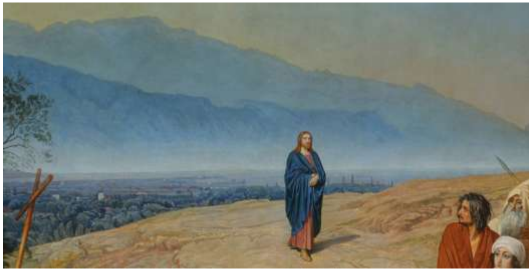
Ил.17. Александр Иванов. Явление Христа народу (Явление Мессии). Фрагмент. 1837–1857. Холст, масло. 540 x 750. Государственная Третьяковская галерея, Москва

Указанная обратимость проявляется и в таких символических оборотах повествования, как то, что Иоанн встречает Христа крестом – пророчествуя в начале мученический конец его земного пути. «Нет черты, которая бы не стоила мне строгой обдуманности» – говорил, имея в виду картину, Иванов 4 . Если так, то вот еще одна черта этой композиционной, или, что одно и то же, символично-эмблематической, математики: в свободной пустоте, обрамляющей пространство, предлежащее фигуре Христа, с двух сторон, под одинаковым диагональным наклоном, обрисовываются ожидающие Христа – ожидающие буквально здесь и сейчас – перекладина креста, древко которого в руке Крестителя, и копьё в руке римского воина. А крест и копьё суть предметы, фигурирующие в повествовании о последнем мгновении земной жизни Христа. Если продолжить эти наклонные диагонали, то точка их пересечения окажется в небе, а на опущенной из этой точки вертикали – фигура Христа.