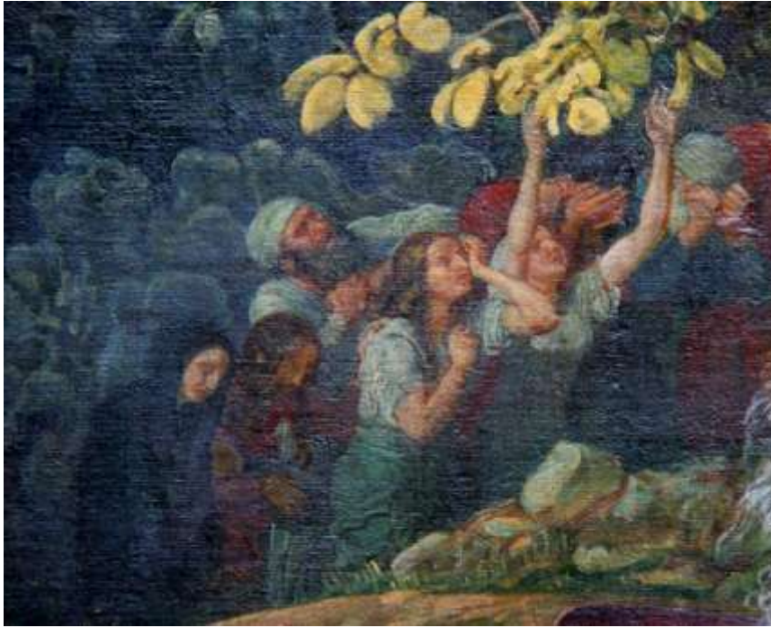
Ил.5. Александр Иванов. Явление Христа народу (Явление Мессии). Фрагмент. 1837–1857. Холст, масло. 540 x 750. Государственная Третьяковская галерея, Москва

На той же композиционной диагонали у Иванова – тоже всадники, правда, не один, а два, и находятся они не в поле притяжения взгляда, а в поле притяжения жеста Иоанна Крестителя. Этой перестановкой Суриков откомментировал, сделал заметным то, что у Иванова незаметно вплетено в жест пророчествующего Иоанна. Указательные пальцы его воздетых рук, в одной из которых крест, образуют ясно ощутимый угол. Следуя взглядом по этим чуть расходящимся траекториям, мы слева упираемся в фигуру Христа, а справа – во всадников. Удвоенным поворотом в профиль, как по команде, всадники фиксируют траекторию, уводящую, минуя Христа, куда-то в крону дерева.