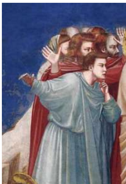
Ил.13. Джотто. Воскрешение Лазаря. Фреска капеллы Скровеньи, Падуя. Около 1306. Фрагмент

«Моя метода – силою сравнения и сличения этюдов подвигать вперед труд», – писал он, делая при этом весьма существенное пояснение: «способ сей согласен с выбором предмета». 3 Например, в фигуре Иоанна Богослова, воспроизведен мотив фигуры того же Иоанна из падуанской фрески Джотто «Воскрешение Лазаря», где Иоанн впрямую обращен к воскресшему.