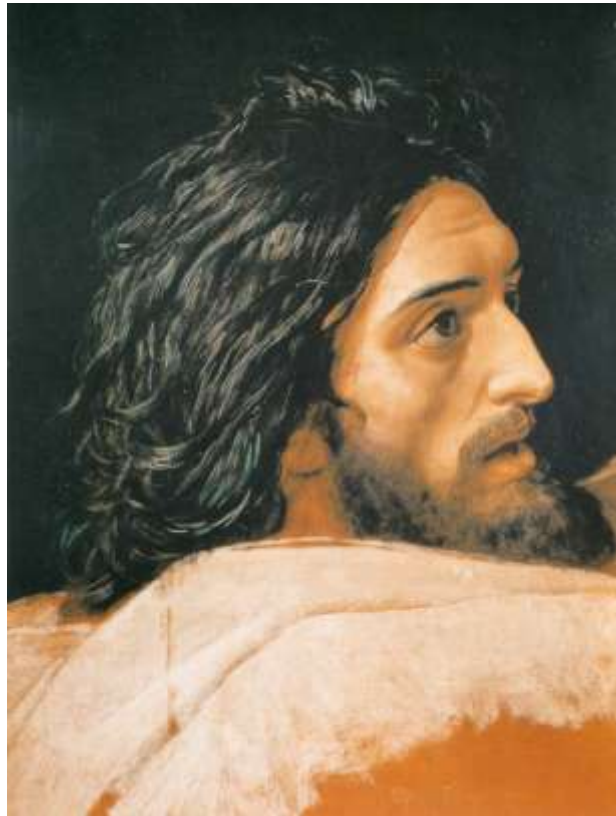
Ил.18. Александр Иванов. Голова Иоанна Крестителя. 1 статьи Герцена от февраля 1858 года, где Александр II уже титулуется освободителем (курсивом в подлиннике) 5 840-е. Этюд. Бумага, наклеенная на холст, масло. 57,7 x 44,1. Государственная Третьяковская галерея, Москва

Иванов в одном из своих писем называет себя «переходным художником» 5 . И если, подражая Иванову, мыслить «математически», то это означает, что экзистенциально он ощущает себя внутри той ситуации, образом и подобием которой является изображенное в его картине. То есть он, в сущности, констатирует, что сейчас в действительности вокруг и перед картиной происходит нечто, для чего изображенное им в картине является идеальным зеркалом – образцом и вещим предзнаменованием. Самое поразительное, что так оно и было.