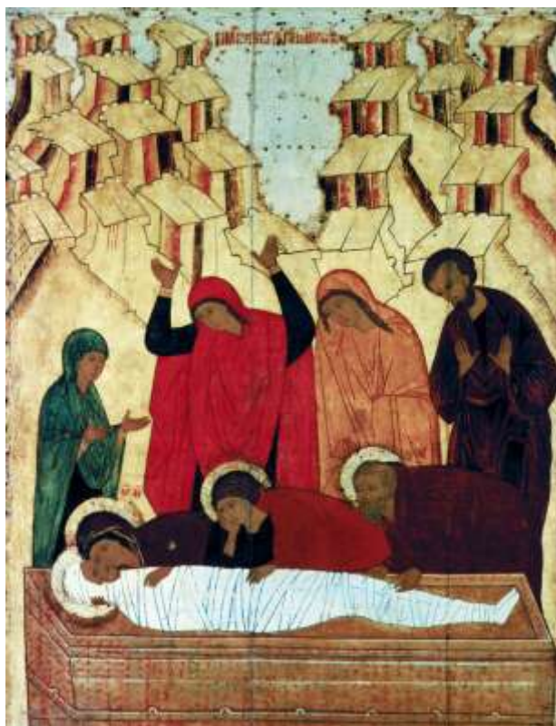
Ил.11. Положение во гроб. Икона. Конец XV века. Государственная Третьяковская галерея, Москва