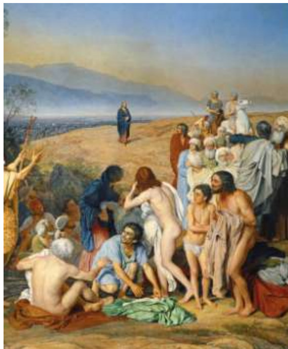
Ил.16. Александр Иванов. Явление Христа народу (Явление Мессии). Фрагмент. 1837–1857. Холст, масло. 540 x 750. Государственная Третьяковская галерея, Москва

Этой же повторностью знаменуется эсхатологическая перспектива совершающегося. Сама «форма плана» картины обладает смысловой обратимостью: сопредстояние Христа и человеческого сообщества в момент Его первого пришествия равноправно прочитывается как прообраз последнего предстояния всех и каждого перед Ним во втором пришествии, в день Последнего суда.