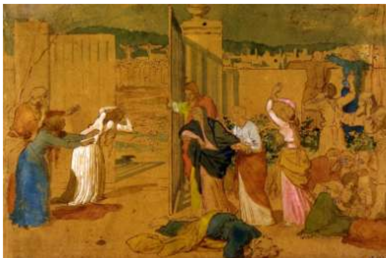
Ил.6. Александр Иванов. Богоматерь и знавшие Христа смотрят на распятие. Из цикла «Библейские эскизы». Коричневая бумага, акварель, белила, итальянский карандаш. 6 x 39,7. Государственная Третьяковская галерея, Москва

Здесь легко узнаваемы традиционные очерки фигур из иконографии «Распятия» и «Положения во гроб».